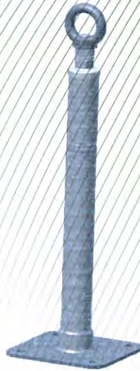
Bild 2: Anschlageinrichtung, Typ: ABS-Lock® X-SR mit Verlängerung