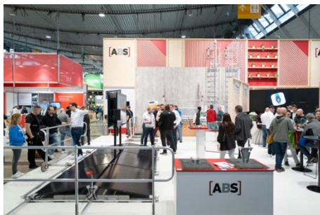
ABS_Dach_Holz_Messe_ - PM 01.jpg

Blick auf den Messestand der Firma ABS Safety GmbH, auf der DACH+HOLZ International 2024