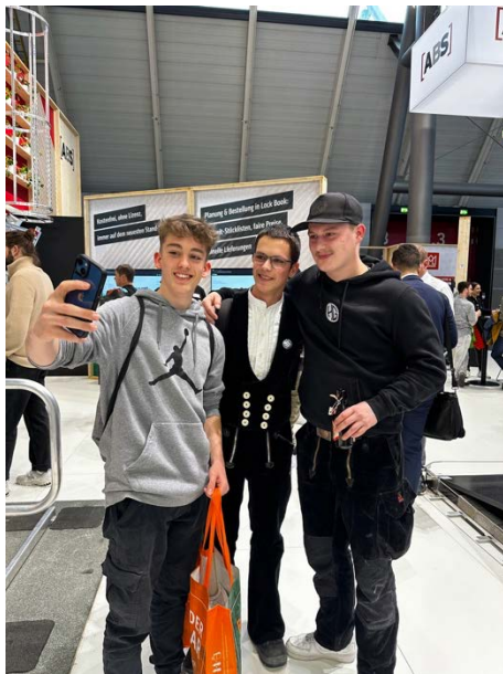
ABS_Dach_Holz_Messe_- PM 07.jpg