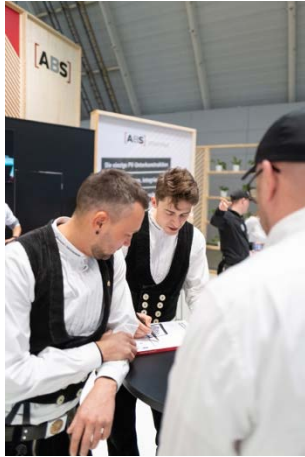
ABS_Dach_Holz_Messe_- PM 06.jpg