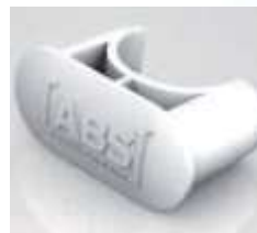
Bild 3: Schutzkappe