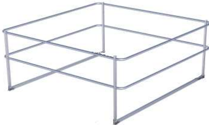
Bild 12: Aufstellvariante des Seitenschutzsystems, Typ: Dome onTop Fusion