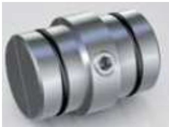
Bild 5: Holmverbinder