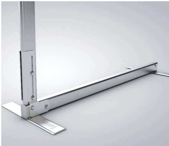
Bild 2: Pfosten mit Ausleger und Langlöcher in dem Verbindungswinkel