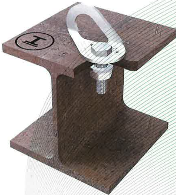
Figure 1 : dispositif d'ancrage, type : ABS-Lock® V-St Montage dans l'acier Dispositif d'ancrage, type : ABS-Lock® V (exemples de montage)

Le dispositif d'ancrage est prévu pour la sollicitation dans toutes les directions.