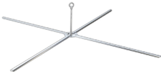
ABS-Lock OnTop Ankerpunt platte daken | lassen