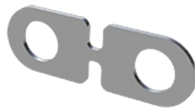
ABS-Lock OnTop Control Force Reservekrachtindicator voor ABS-Lock OnTop Control