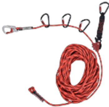
ABS Lanyard - Tijdelijke positioneringslijn PBM